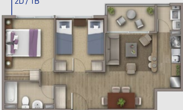
MODELO CIPRÉS 49,83 m 2 2D / 1B