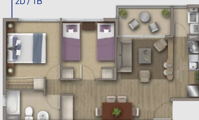
MODELO TAYÚ 49,97 m 2 2D / 1B