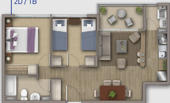
MODELO CIPRÉS 49,95 m 2 2D / 1B