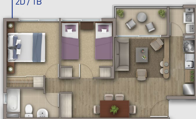
MODELO TAYÚ 50,09 m 2 2D / 1B