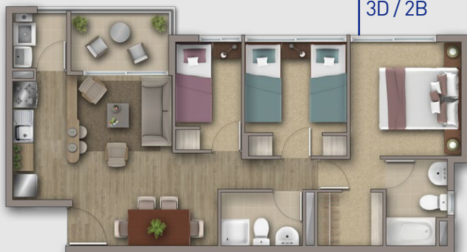
MODELO PATAGUA 56,05 m 2 3D / 2B